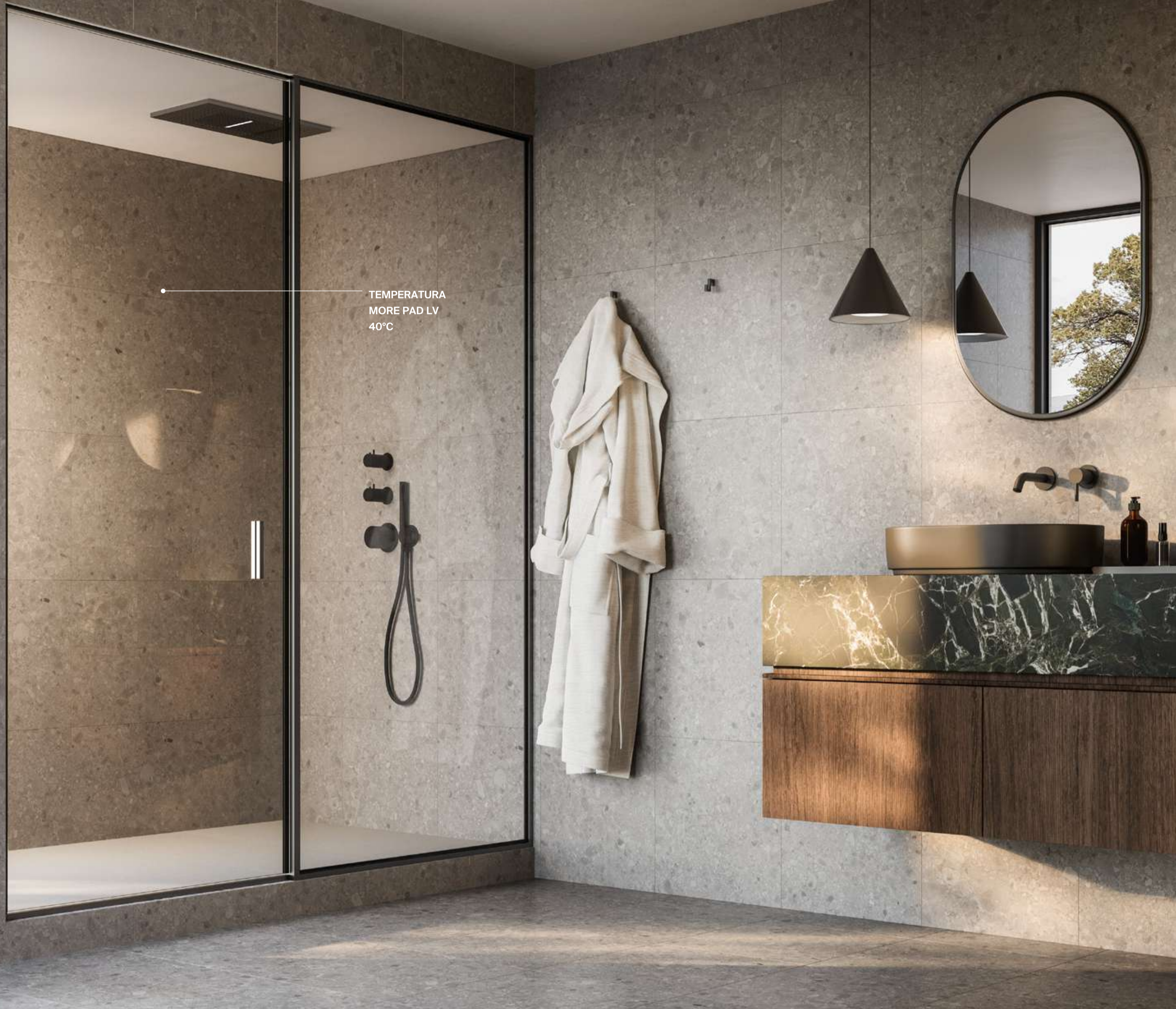
MORE PAD LV INSTALLATO NEL BOX DOCCIA

SOTTOFONDO Applicazione: su strutture in muratura e in cartongesso, già termicamente isolate e architettonicamente non lineari.