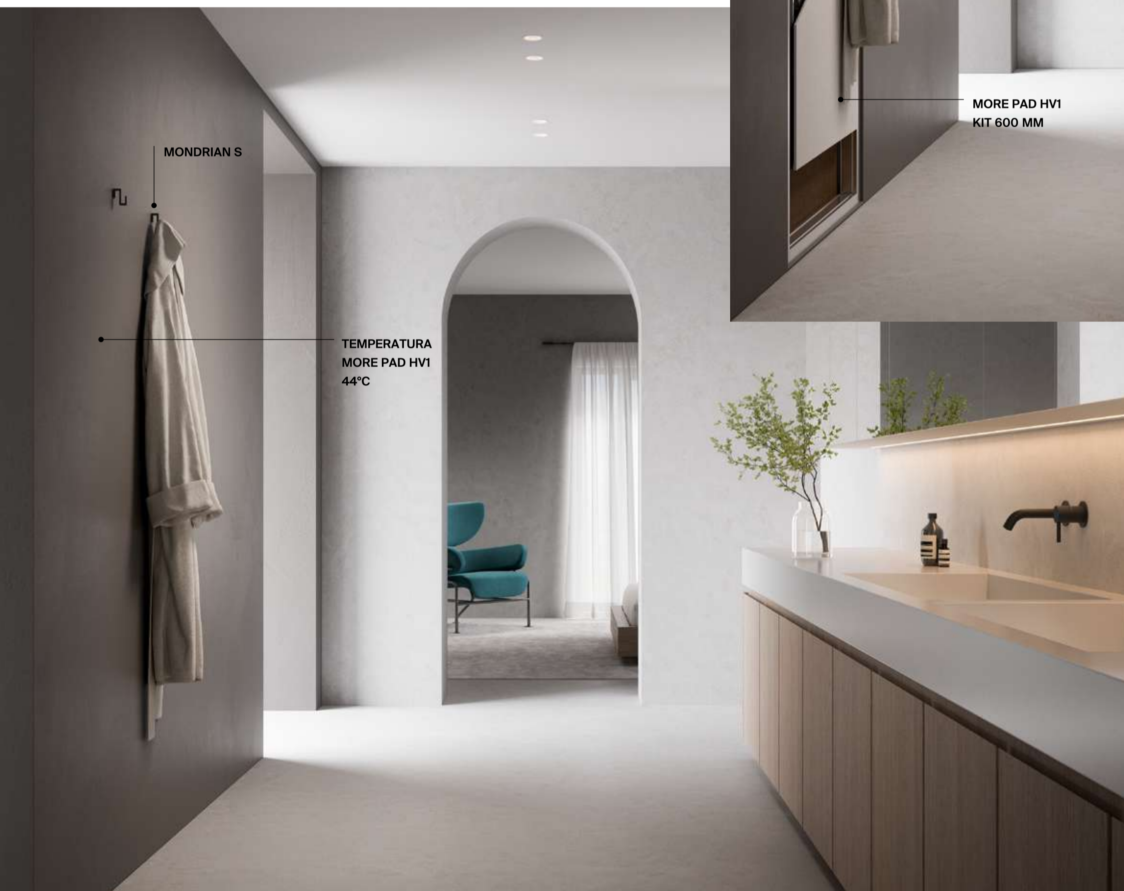
MORE PAD HV1 CON APPLICAZIONE INTEGRATA, SU STRUTTURA IN CARTONGESSO E FINITURA IN RESINA