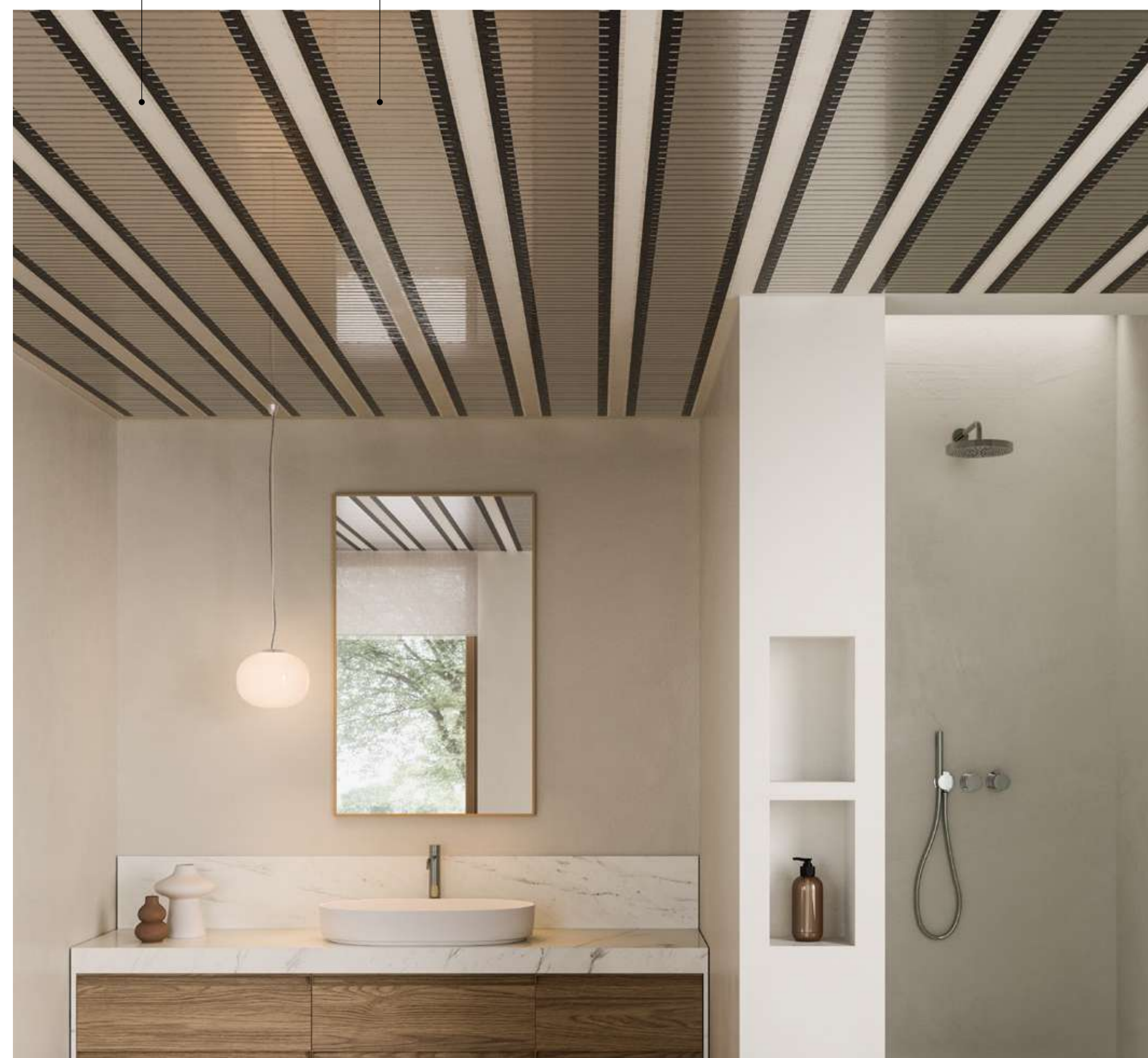
MORE PAD HVr INSTALLATO A SOFFITTO